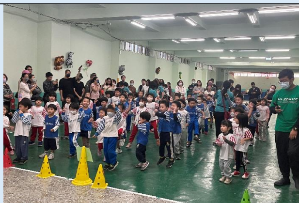
大家一起動一動~律動歌曲