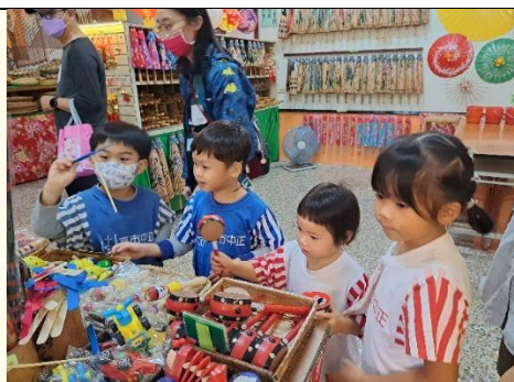
鳳梨班~傳統文物逛街趣