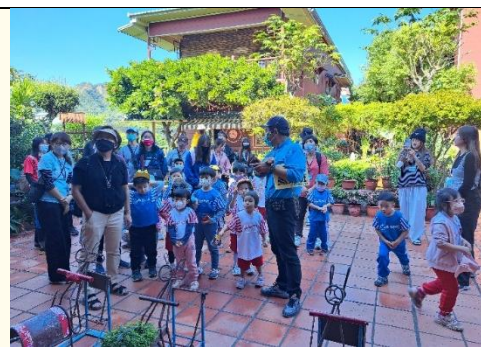
鳳梨班~介紹客家文化