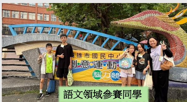
語文領域參賽同學