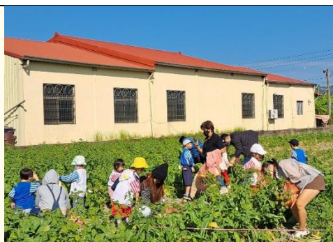
鳳梨班~拔蘿蔔真有趣