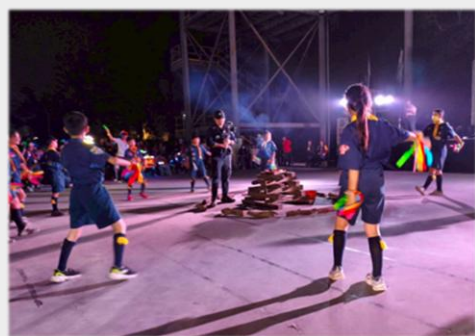
營火節目「大展鴻圖」精采演出