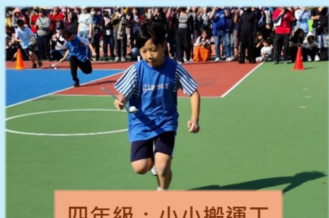
四年級：小小搬運工