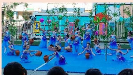
五年級民俗舞-竹影水韻舞傣河

輔導處在 114 年 12 月 17 日舉辦了一場中正國小限定的「舞展搶先看」活動，讓本校的同學在 114 學年度舞蹈班成果發表會舉辦前，有機會優先一睹精彩節目內容，一起體會舞蹈藝術之美。