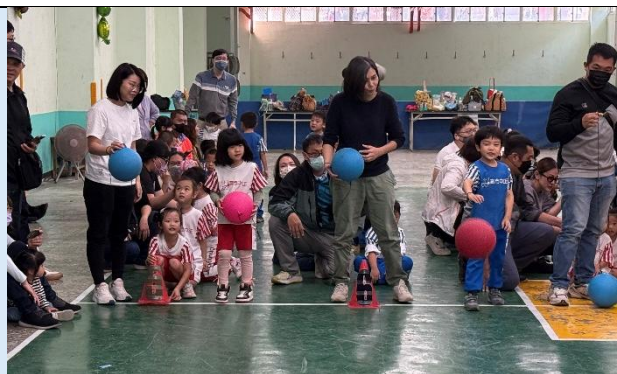
親子運動~我是拍球高手