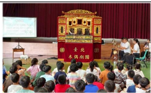
國樂現場配樂演出精彩的布袋戲

臺北木偶劇團布袋戲活動《阿貴的涼亭》於114年11月17日為本校小朋友們帶來一場充滿笑聲的互動演出！演出者用逗趣又生動的對白，搭配靈活又厲害的手法，讓布袋木偶彷彿真的活了起來。演出結束後，還有布袋木偶體驗時間，小朋友們親手操作戲偶，學習讓木偶跑起來，近距離感受傳統布袋戲的魅力，在歡樂又驚喜的氣氛中，留下滿滿的回憶。