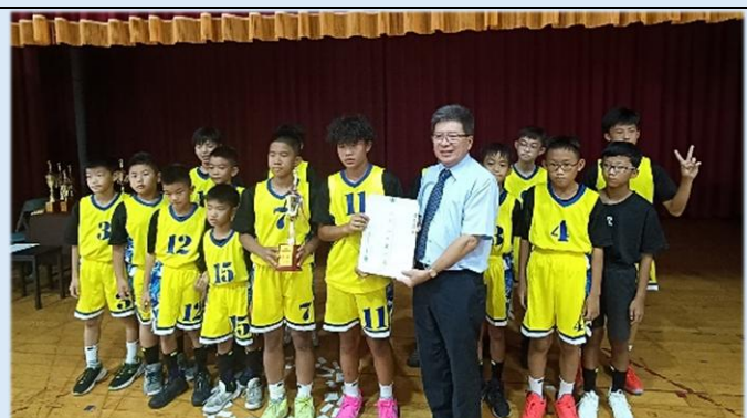
校長親自頒獎，格外溫馨！