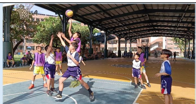
一躍而上，所向披靡！