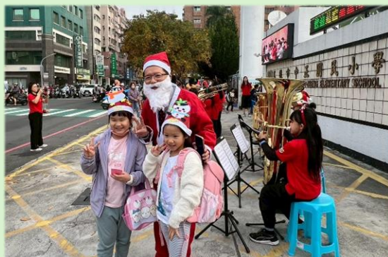
聖誕老公公一早和小朋友打招呼合影

雪花隨風飄……聖誕老公公於 114 年 12 月 24 日上午帶著歡喜糖來到中正國小。感謝家長會的支持與全力動員，搭配管樂班應節的精選曲目演出，把溫馨歡樂散播在校園每個角落！