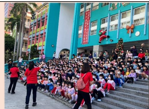
活潑熱情~管樂班招生音樂會就是要你啦！

114 學年度管樂班招生音樂會於 114 年 12 月 18 日開演，管樂班親師生卯足全力，把最美好的演出呈現在二年級師生面前，管樂悠揚~期待二年級的你加入！