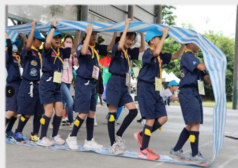
中正小狼總能最快最好完成目標