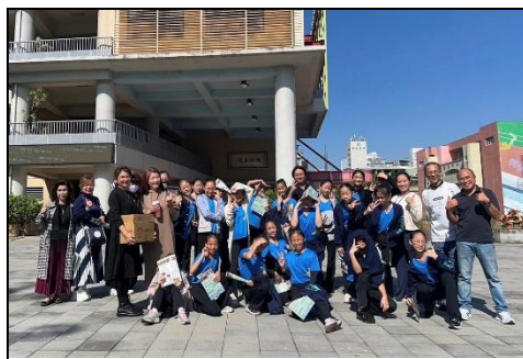
與苓雅國中師長相見歡

六年級舞蹈班同學於 114 年 12 月 30 日前往苓雅國中舞蹈班參訪，由苓雅師長安排認識該校舞蹈班，並讓同學們體驗舞蹈課程。