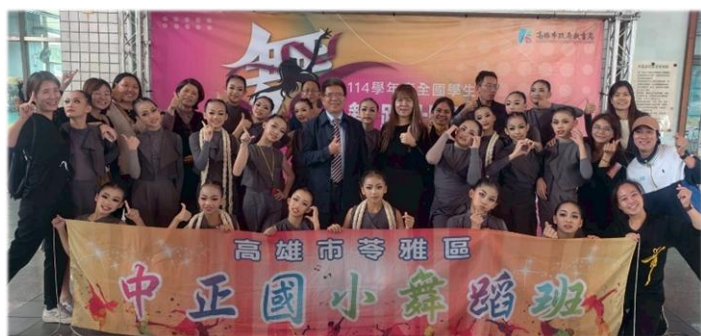
114 年 11 月 20 日全國學生舞蹈比賽高市初賽南區國小 A 團體乙組現代舞「拉扯」榮獲特優，代表高雄市參加全國賽。