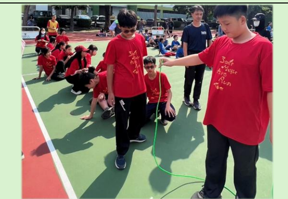
鳳凰同學和中正同學一起參與趣味競賽