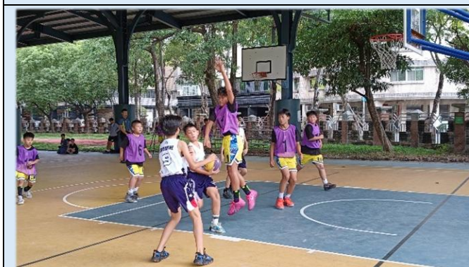
隻手遮天，銅牆鐵壁！