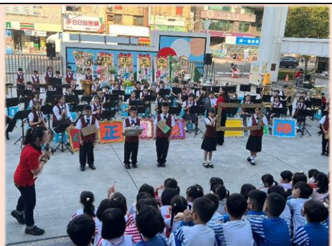
全團親師生賣力演出，小小觀眾也聽得入神。