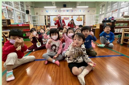
校長和會長帶著歡樂、帶著禮物送給每位幼兒園小朋友。