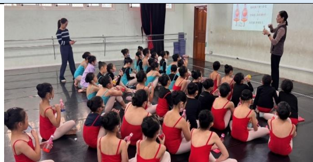
老師以自製呼吸運動模型解釋呼吸作用原理