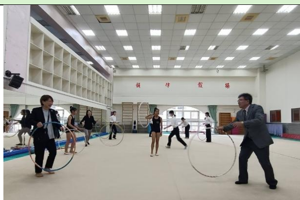
校長陪來賓一起體驗對拋環，大家滿頭大汗