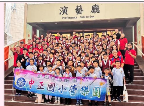
全體親師生大合照