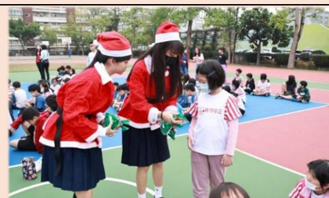
道明中學的哥哥姊姊贈送糖果