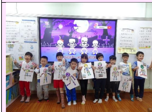
身體可以做出哪些動作