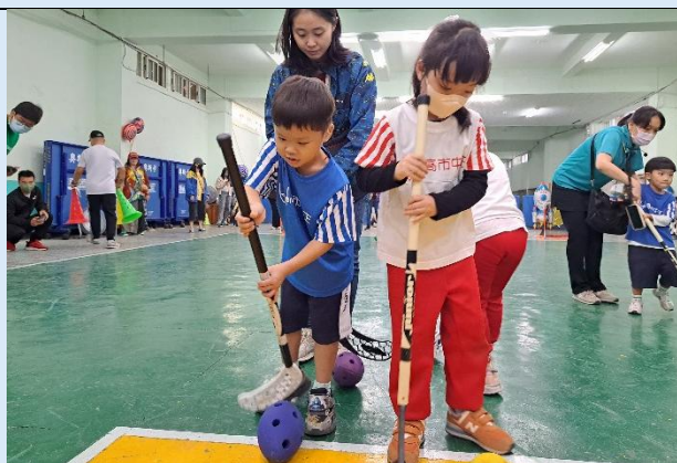
親子運動~推球小勇士