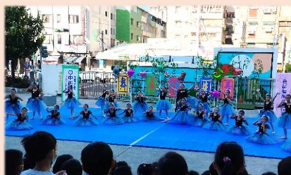
三年級現代舞-泡泡魔咒