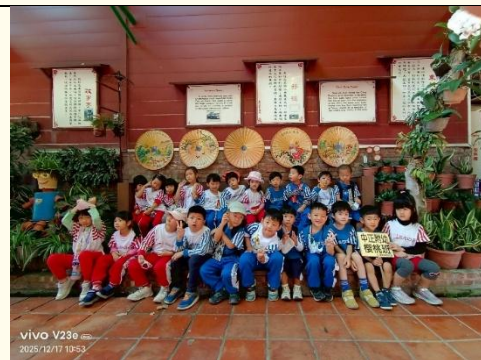
櫻桃班~美濃民俗村大合照