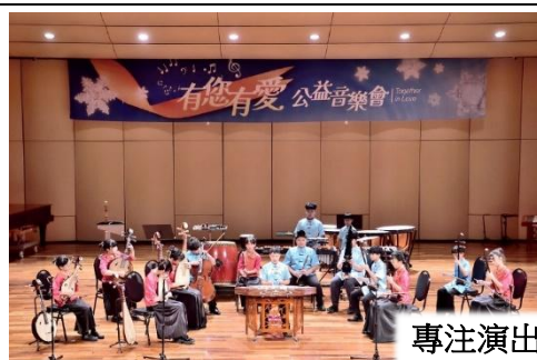
專注演出精采曲目