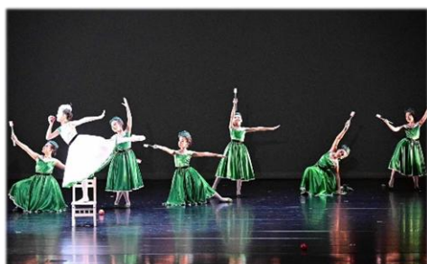
五年級即興創作--蘋果小孩