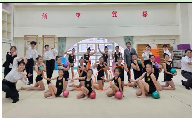
參與交流的學生們大合照