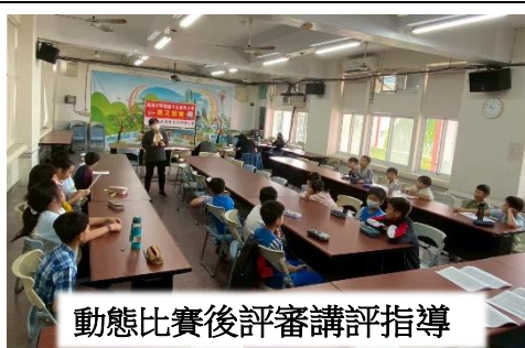
動態比賽後評審講評指導