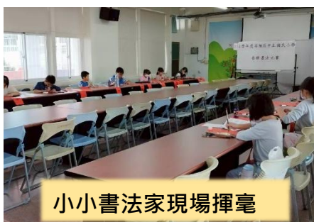
小小書法家現場揮毫

教務處配合即將到來的新春節慶，於 114 年 12 月 18 日舉辦春聯書法比賽，以推展傳統書法藝術，並增添年節氣氛。