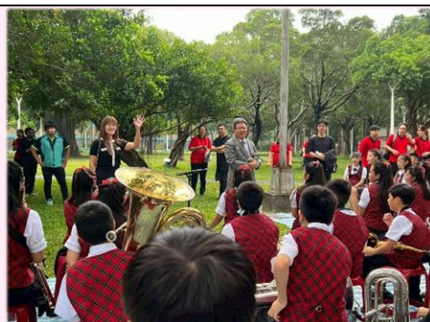
校長及家長會王會長為師生加油打氣。