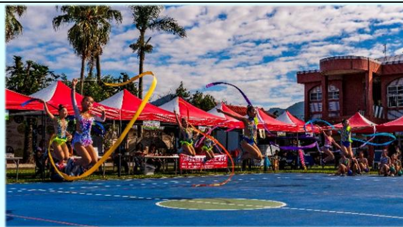
蔚藍天空搭配曼妙律動，構成最美的畫面