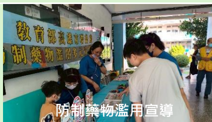
防制藥物濫用宣導