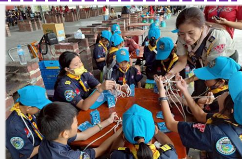
用餐的間隙，搶時間練繩結。