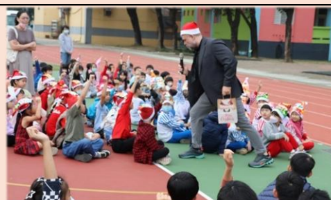
外籍老師趣味問答