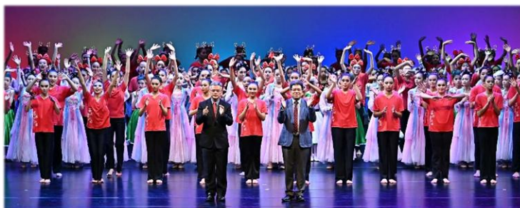
兩校校長帶領舞者精彩謝幕