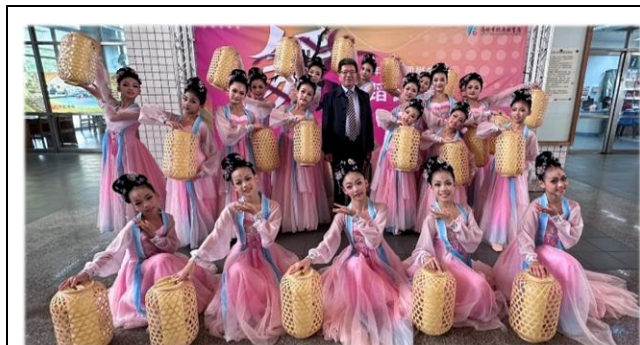
114 年 11 月 20 日全國學生舞蹈比賽高市初賽南區國小 A 團體乙組古典舞「燈河麗影舞秦淮」榮獲特優，代表高雄市參加全國賽。