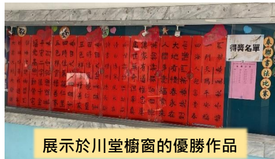
展示於川堂櫺窗的優勝作品

教務處配合即將到來的新春節慶，於 114 年 12 月 18 日舉辦春聯書法比賽，以推展傳統書法藝術，並增添年節氣氛。