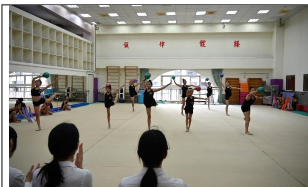
觀賞韻律體操表演，驚呼聲和掌聲連連。

東京學藝大學於114年12月18日到本校參訪交流，觀摩韻律體操術科課程，也難得能體驗練習韻律體操，孩子們展現韻律體操成套，更是讓東京學藝大學的準老師及教授們驚豔於中正的活力樂學～精彩萬分！