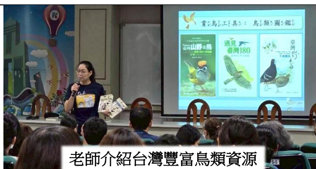
老師介紹台灣豐富鳥類資源