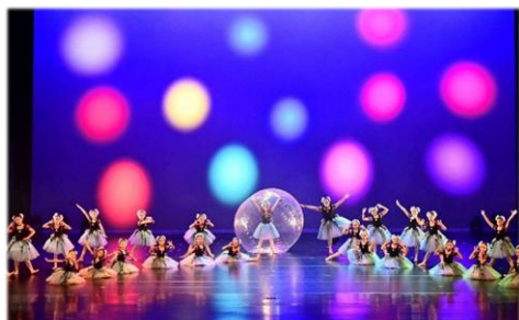
三年級現代舞—泡泡魔咒