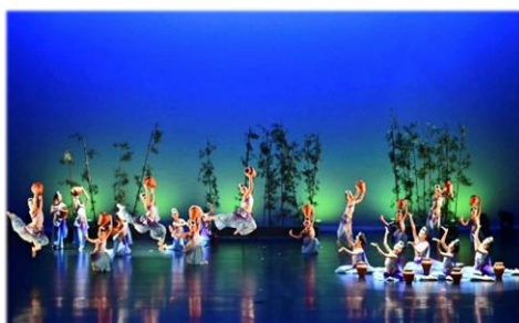
五年級民俗舞--竹影水韻舞傣河