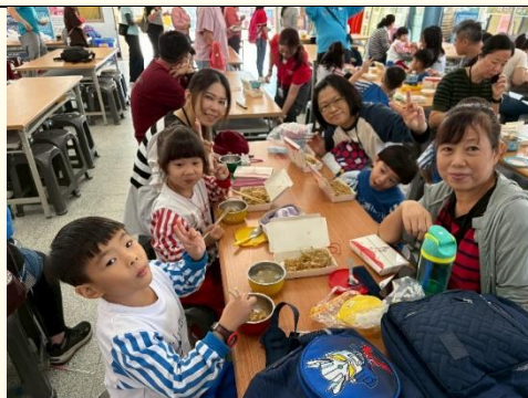
蘋果班~享用客家甞條