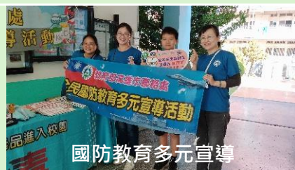
國防教育多元宣導