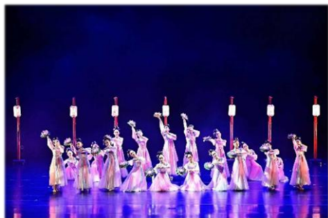
六年級古典舞--燈河麗影舞秦淮

114 學年度中正國小・苓雅國中舞蹈藝才班教學成果發表會，於 114 年 12 月 24 日在高雄市文化中心至德堂舉行。今年的成果發表會由苓雅國中主辦，舞展主題為「舞熠」，寓意每一位舞者在舞台上發光發熱，將長時間的練習、汗水與信念化為耀眼的瞬間；舞步如火焰般跳動，情感如光一般流轉，照亮舞台，也感染觀眾，化為感動的喝采及掌聲，久駐在每個人的心間。