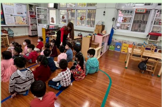
家長會王會長到幼兒園一一發送糖果給可愛的孩子們。