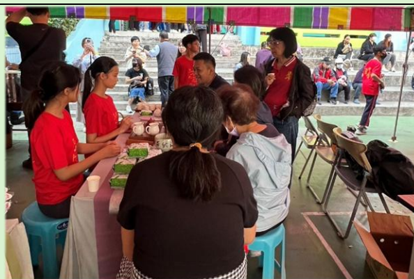
姊妹校鳳凰國小蒞校指導品茗藝術

114 年 12 月 6 日本校校慶運動會，南投姊妹校鳳凰國小校長帶領行政人員、師生暨家長會會長、委員等，蒞校指導同樂。