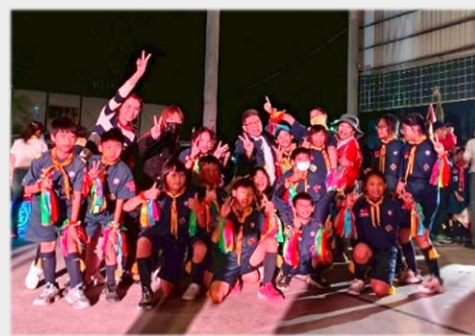
謝謝校長與家長會為我們加油！