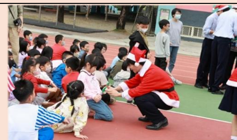
聖誕糖果,希望大家吃得開心