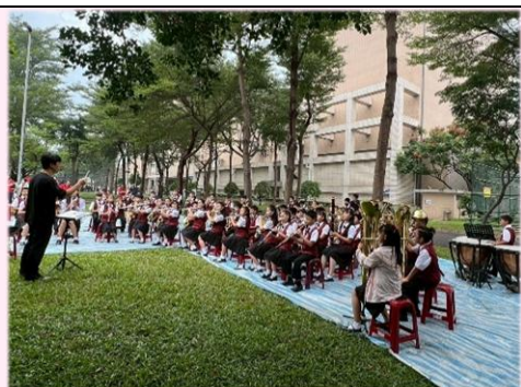
在家長後援會大力協助下，師生抓緊片刻雨停時間作賽前練習。

114 年 11 月 10 日管樂班參加全國學生音樂比賽高雄市初賽，雖然當日天空不作美，但校長及家長會會長仍親自到小港社教館為管樂班師生加油打氣，令人備感溫馨。本校榮獲優等佳績，並取得全國賽代表權資格。感謝全團小朋友的努力，以及家長及全體老師們的付出、陪伴與指導。