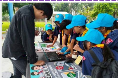
一起完成小組任務