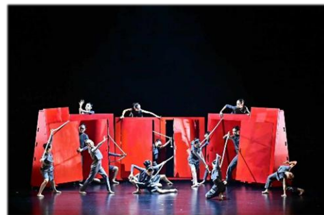
六年級現代舞--拉扯