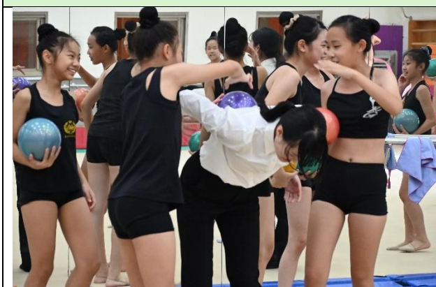
來賓體驗韻律體操活動