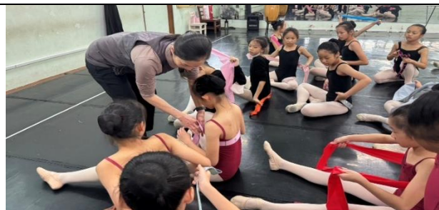
幫助舞者了解正確的發力方式、運動鏈條。