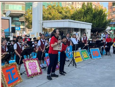
管樂班有最美的笑容、最歡樂的笑聲、最悅耳的樂聲、有.....，歡迎加入管樂大家庭。