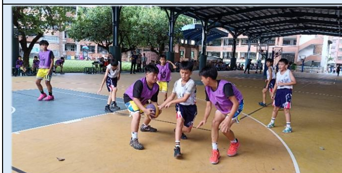
雙龍搶珠，超截成功！