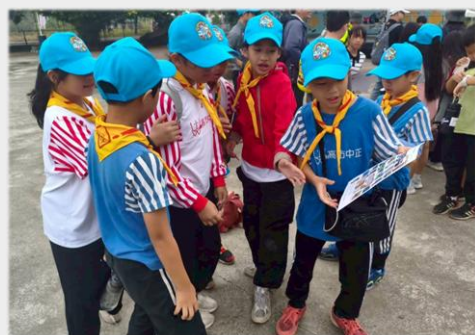
定向追蹤，向著目標前進！