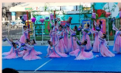
六年級民俗舞-燈河麗影舞秦淮