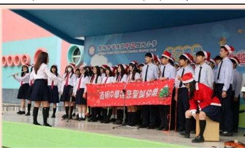
照片似乎也傳出了美妙的歌聲