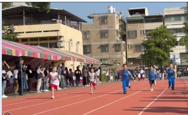
幼兒 40 公尺跑步比賽