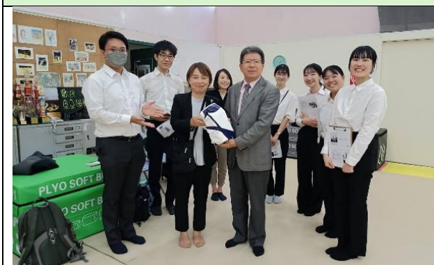
來賓致贈本校體物