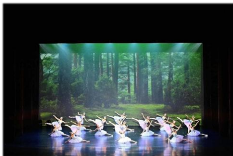
六年級芭蕾舞—森林仙子