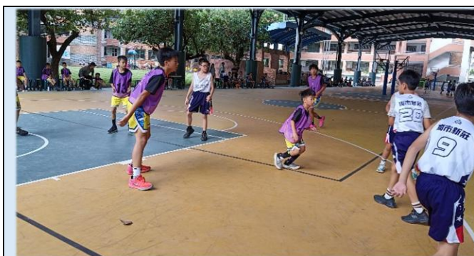
個子雖小，衝勁十足！

此次參加在小港區華山國小舉行的高雄市 114 年國小體育促進會籃球比賽，全體隊員齊心協力，一路過關斬，勇奪六年級男生乙組亞軍，為校爭光，表現優異！