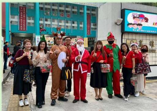
聖誕老公公家族校門口歡樂合影