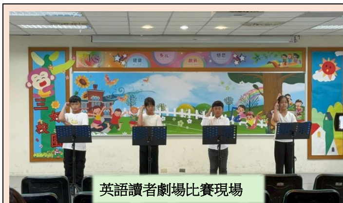
英語讀者劇場比賽現場