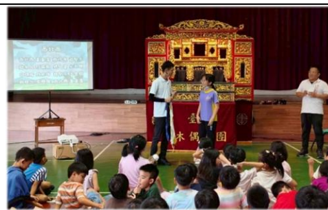
活動結束前還有有獎徵答呢！