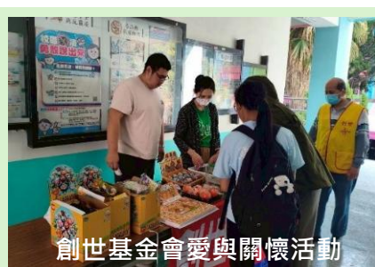
創世基金會愛與關懷活動