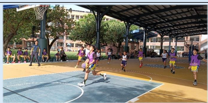
單槍匹馬，直搗黃龍！