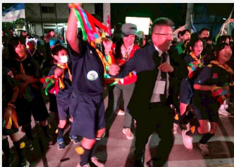
小狼與校長、貞怡老狼共舞