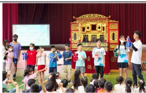
小朋友們體驗操作布袋戲偶