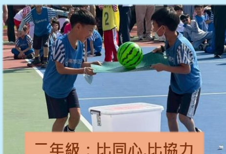
二年級：比同心,比協力