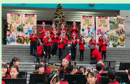
三年級管樂班同學以直笛演出聖誕組曲，祝福大家平安快樂。