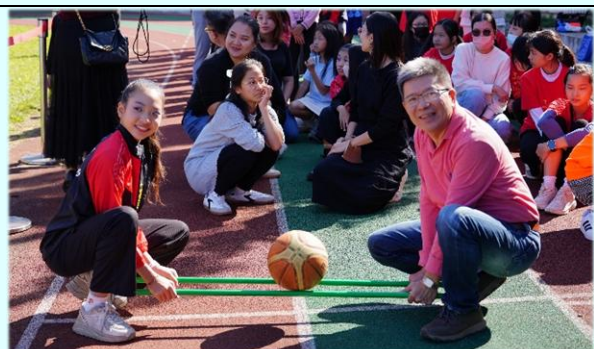
校長和韻律體操同學一同參與趣味競賽