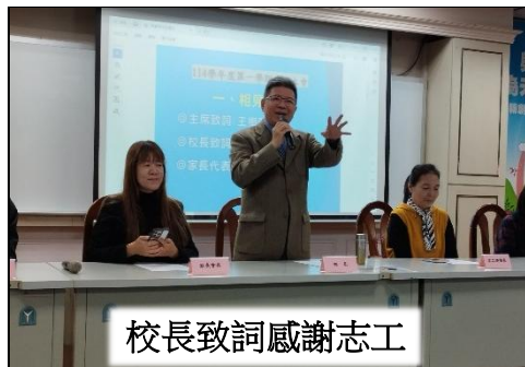
校長致詞感謝志工