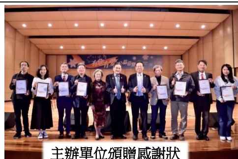
主辦單位頒贈感謝狀

114 年 12 月 13 日絲竹樂團受邀參加阿公店扶輪社、尚仁教育發展協會舉辦之「有您有愛/公益音樂會」，雖然年紀小，也可為公益付出，募集經費讓更多弱勢的孩子學習國樂，並推廣「品德教育」。