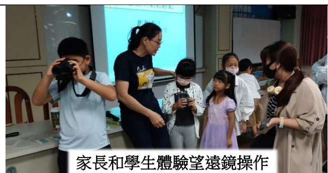
家長和學生體驗望遠鏡操作

114年11月18日親職講座邀請蘇美英老師演講「認識高雄市親子戶外活動賞鳥資源」，以豐富的內容、精闢的講解，帶領大家認識高雄多樣的生態與賞鳥據點，發掘親子共遊的新選擇。